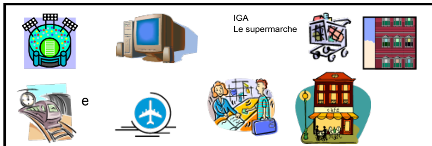
IGA Le supermarché